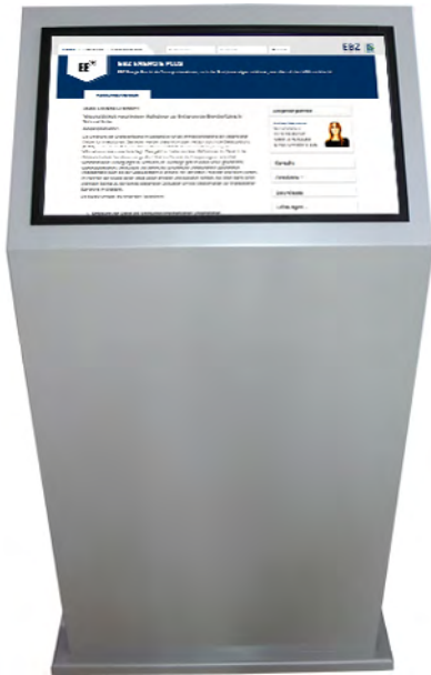
Informations-Terminal an diversen Standorten im EBZ und auf Veranstaltungen.

„Wir legen unseren Kunden nah, sich über das WIKI zu informieren und nicht zu googeln“