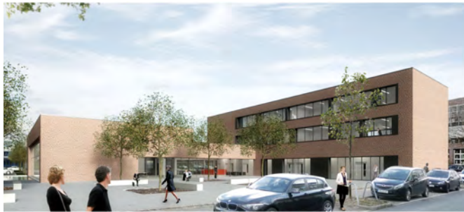
Lernzentrum Gewinner Gerber Architekten „So könnte der Neubau aussehen“